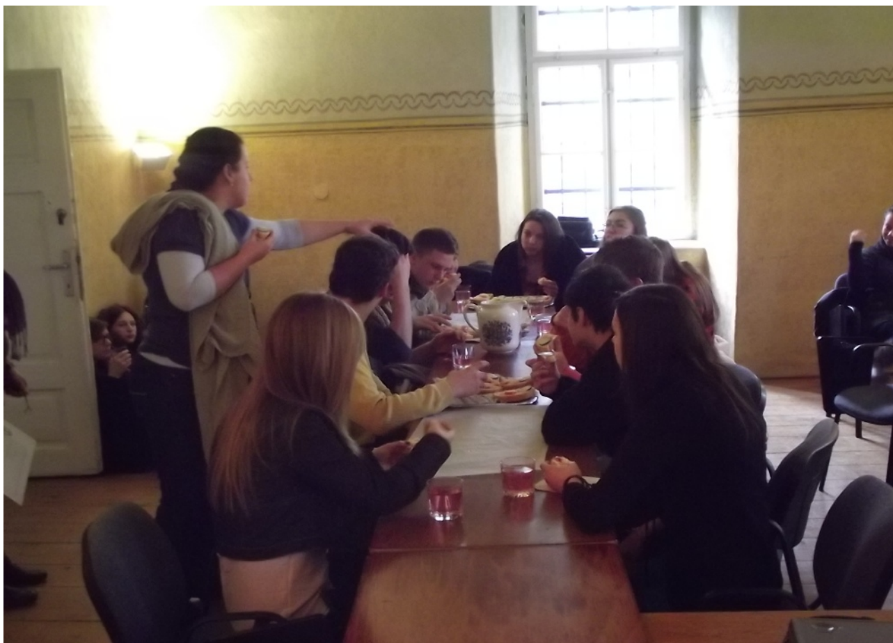
Teológiai szakmai program