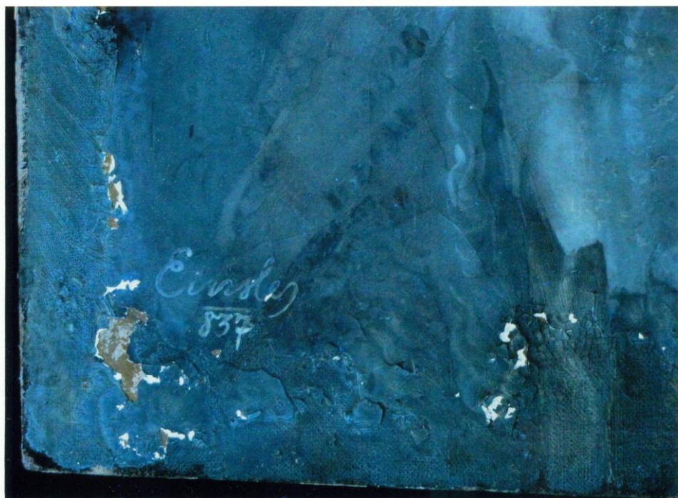
6. UV fényben jól látható, hogy a javító festés felületén van a jelzés. A javítás sötétebb