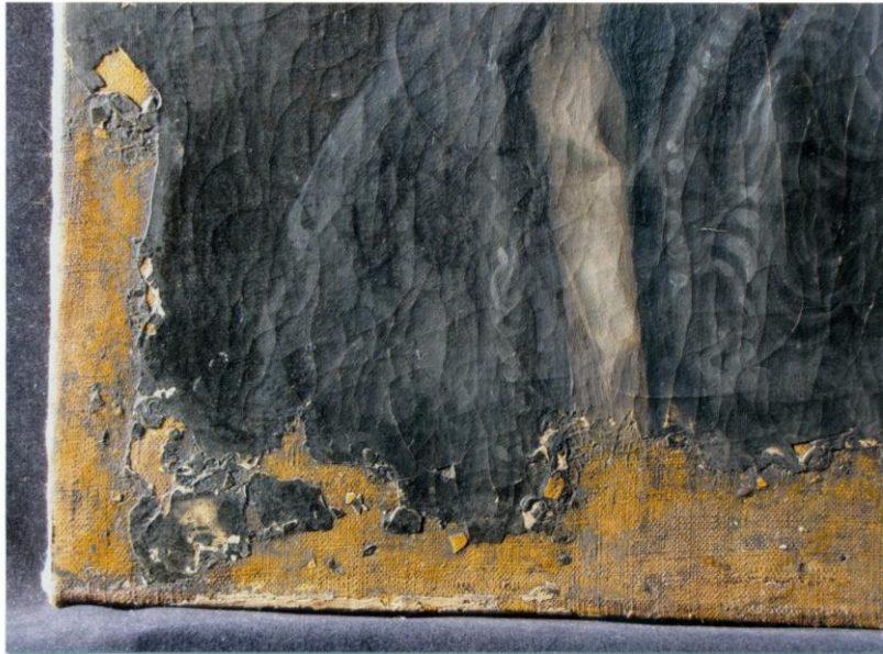
7. Konzervált, feltárt állapot, súrló felvétel a hiányos bal alsó sarokról, a szignó leoldódott a javító festéssel együtt.