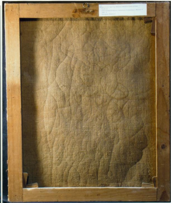
1. Átvételi állapot BÁRÓ ADELSHEIM JOHANNA