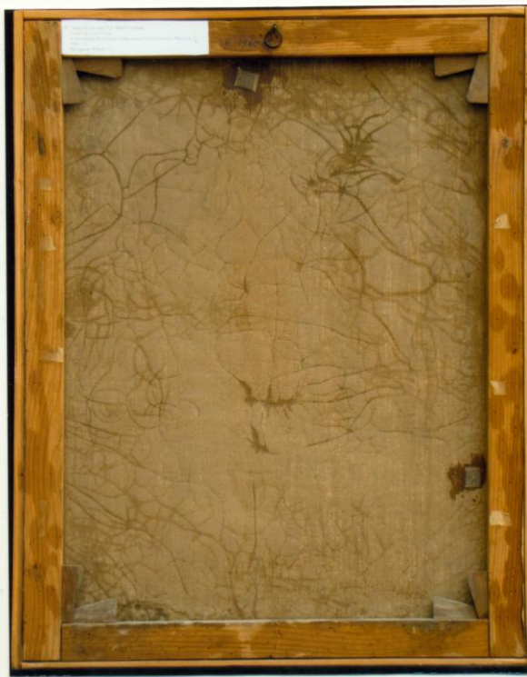
1. Átvételi állapot VAY MIKLÓS BÁRÓ PORTRÉJA 3. Átvételi állapot, sűrű fényben