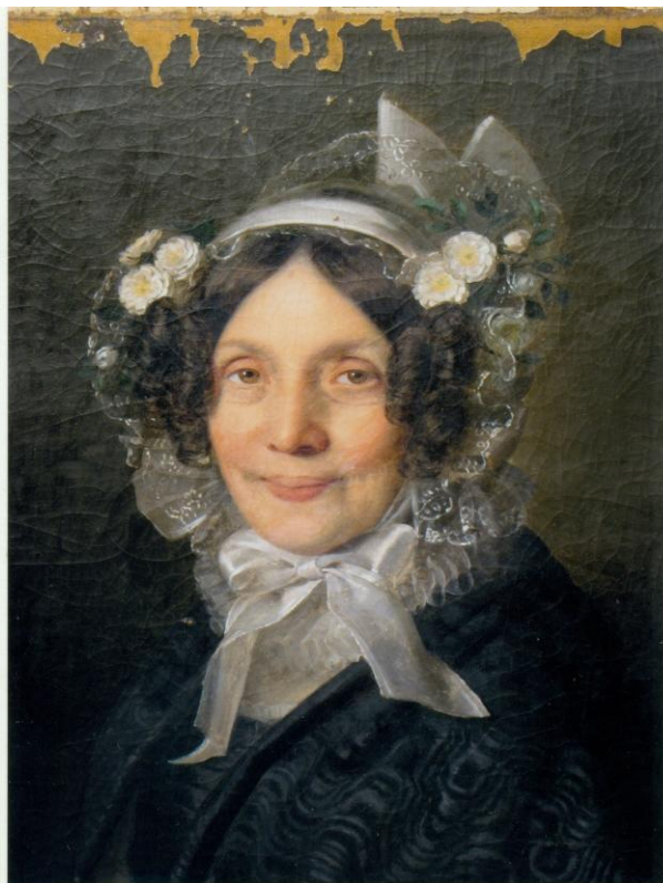
18. Konzervált, tiszta állapot 20. Retusált, kész állapotban a kép részlete