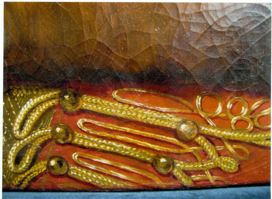
8. Kész állapot