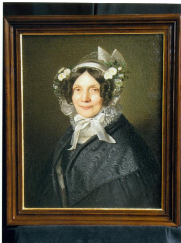
22. Az új díszkeretbe helyezett festmény