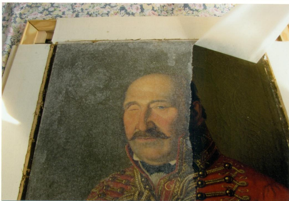
5. A BEVA oldattal konzervált kép feszítőkereten, az új húzószéllal. A metilcellulózisos japánpapír levédés leoldása közben.