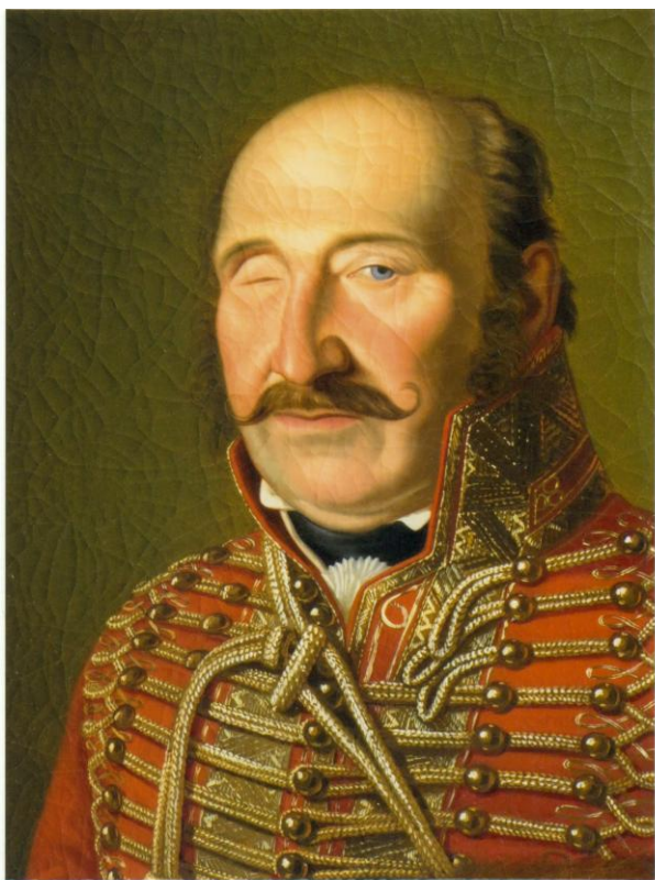
10. Kész állapot