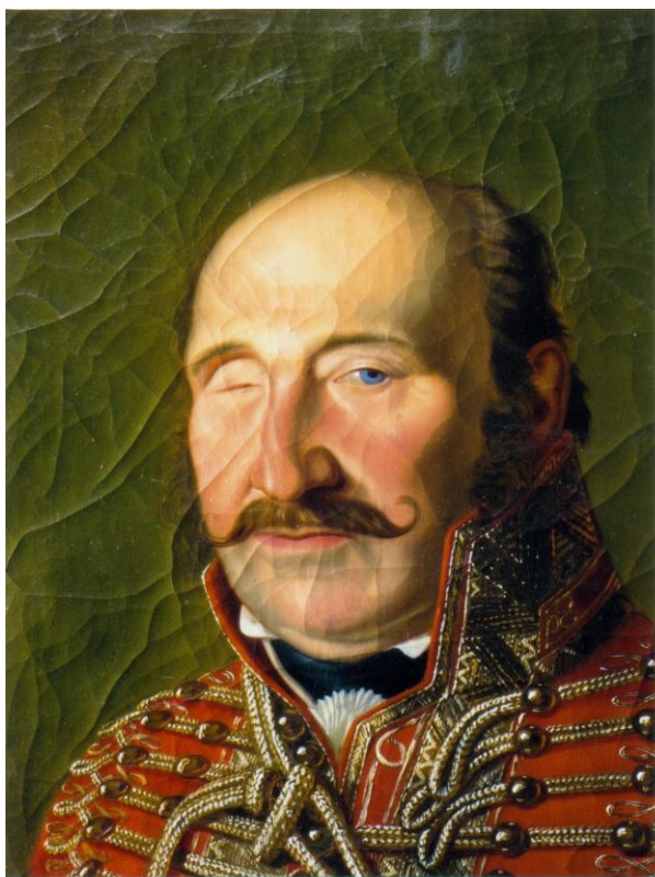
9. Átvételi állapot, súrló felvétel: a kagylósodás jelentős