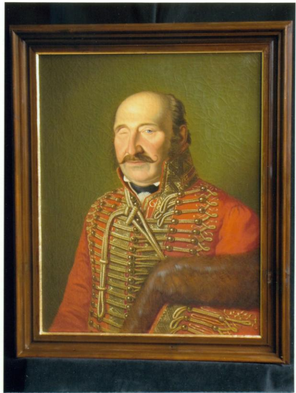
12. Az új díszkeretbe helyezett portré