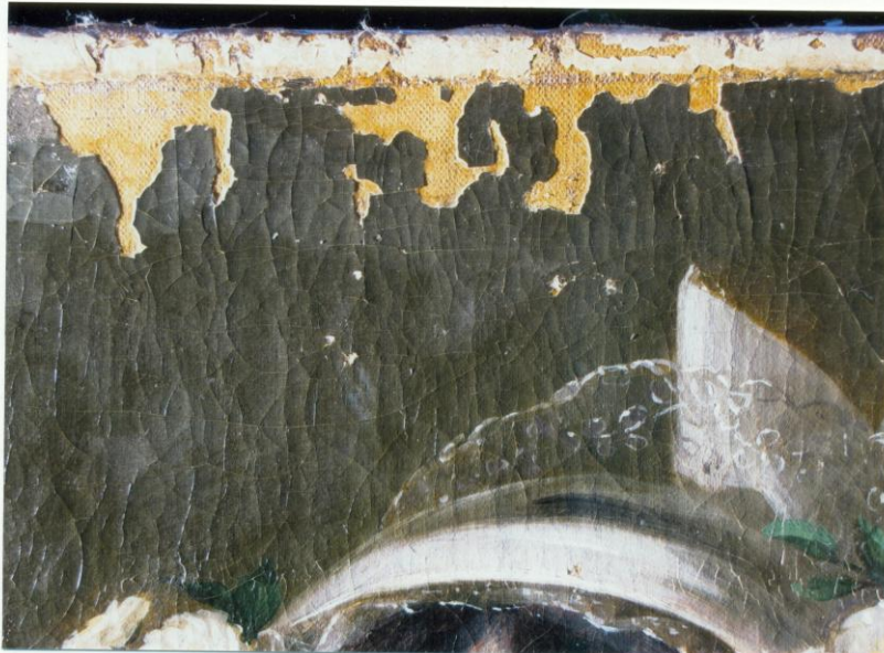
16. A kép felső részén jól látható a húzószél egy részével megnövelt képméret