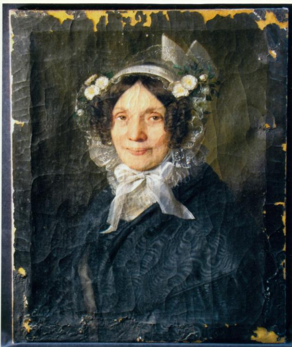
4. UV fényben az egyenetlen lakk és javítások láthatóak