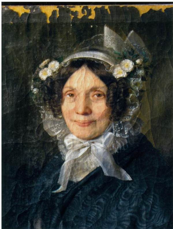
17. Átvételi állapot súrló fényben 19..Tömítés után