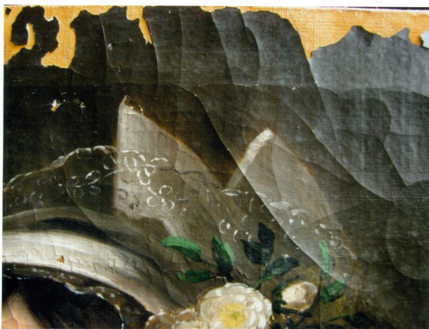
12. A kép hiányos felső része. Jól látszik a sárga első alapozás. A festékréteg a levegő