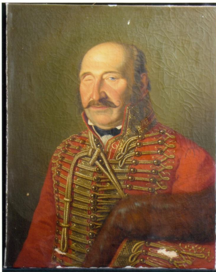
6. A konzervált, tisztított, tömített állapotú festmény