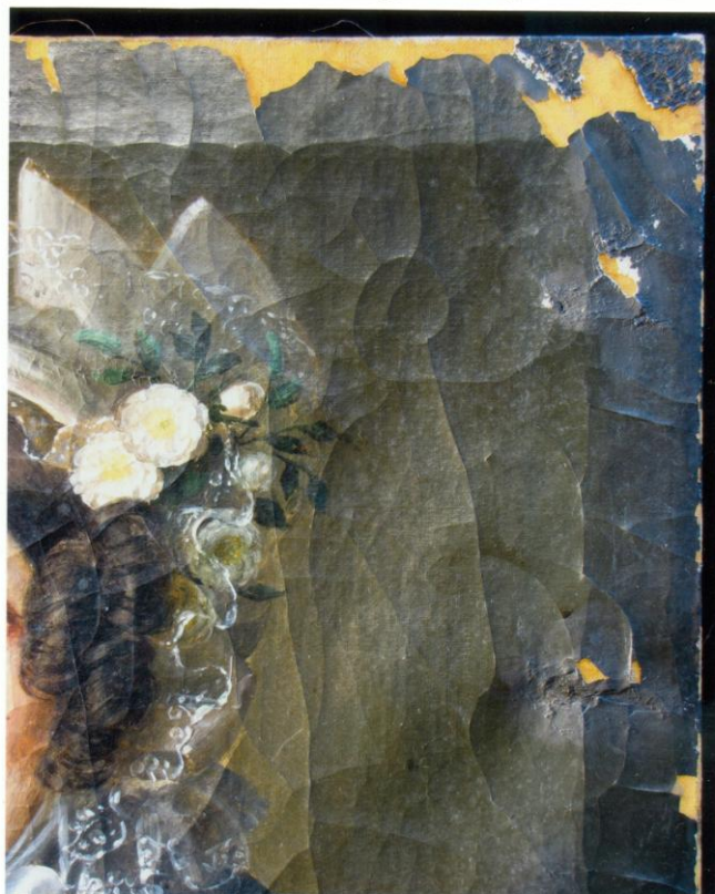
13. A jobb felső sarok jellemző sérülésekkel. Erősen kagylós a festékréteg.