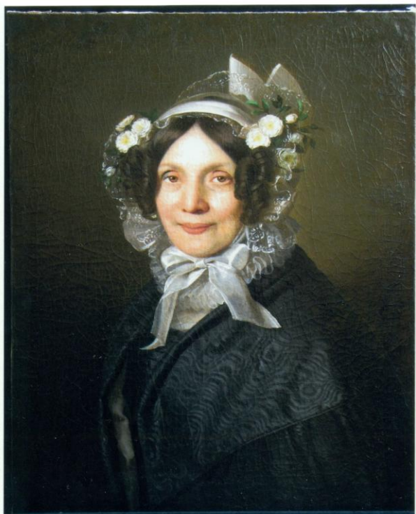
21. A restaurált portré