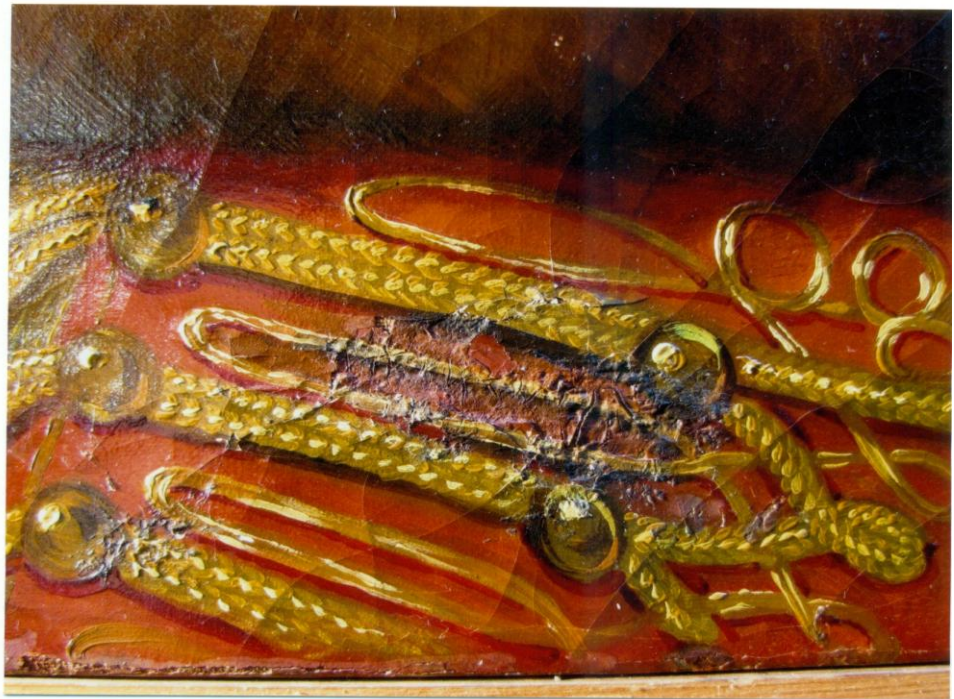
7. A kép sérült részlete átvételkor. Tömés nélküli olajfestéssel készült javítás.