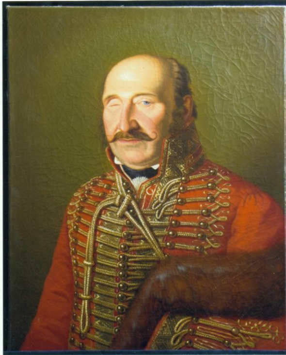
11. A restaurált festmény