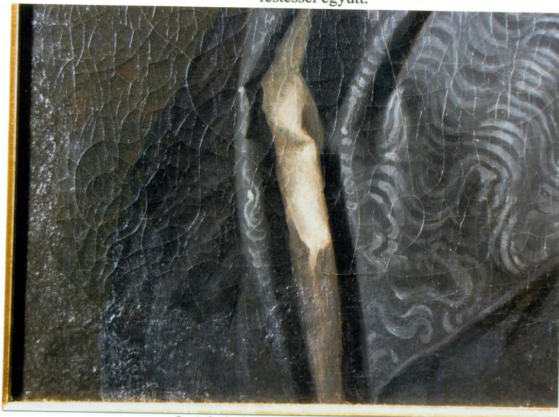
8. A bal alsó sarok restaurálás után