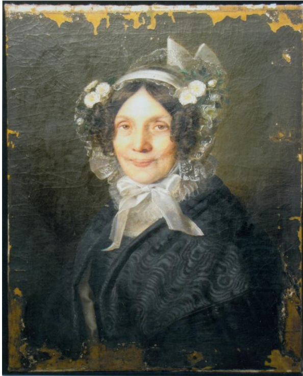
14. .A konzervált kép tisztítva, feltárás után.