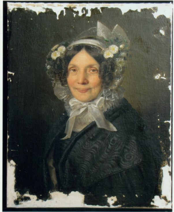
15. Tömítés után